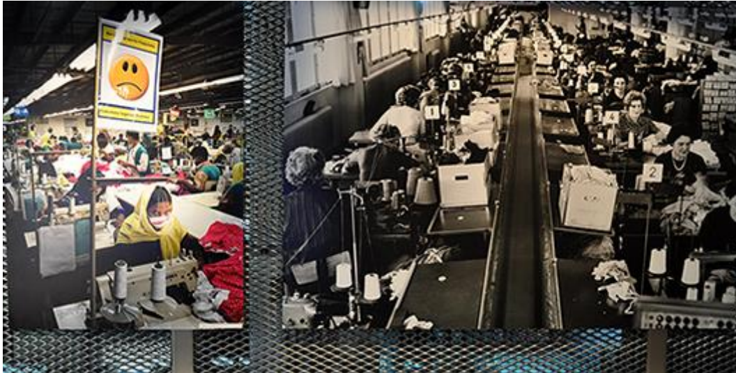
Två foton som ordlöst talar med varandra över tid och rum. Kvinnan till vänster stigmatiseras med en sur gubbe som visar att hon inte nått produktionsmålen.

För många kvinnor innebar den tekoindustriella revolutionen i Borås att de fick ett eget arbete, egen lön och ett liv utanför hemmet. De utnyttjades samtidigt på ett skamlöst sätt och betalade med sina kroppar, med förslitningsskador och ohälsa. Termen "kvinnokraft" får successivt en ny innebörd när man vandrar genom utställningen.